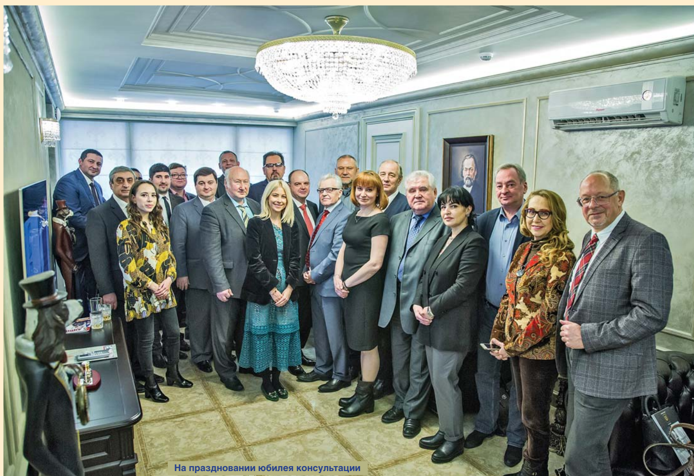
На праздновании юбилея консультации